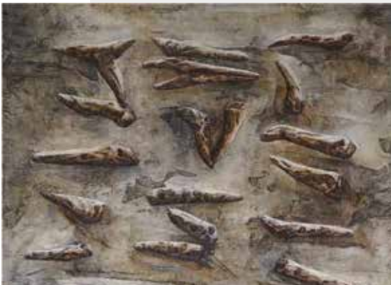
Nathalie H. Cloutier, Inventaire , 2021, (détail), Encaustique. Gagnante de l'Expo-concours 2024.

L'événement a donné lieu à un vernissage public et à une remise des prix le 17 novembre, ainsi qu'à l'annonce du prix Coup de cœur du public diffusée en ligne le 20 décembre.