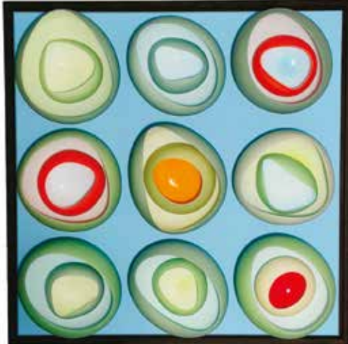
Tableau 3D #1. Verre soufflé et cadre peint, 61 x 61 x 7,5 cm.