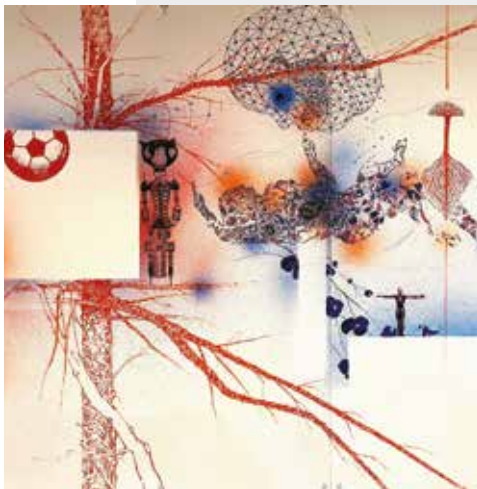
L'envie de raconter - Longing To Tell, fragment. Dessin au tampon encreur et à l'encre acrylique sur papier, 114,3 x 106,7 cm, 2021/2024.