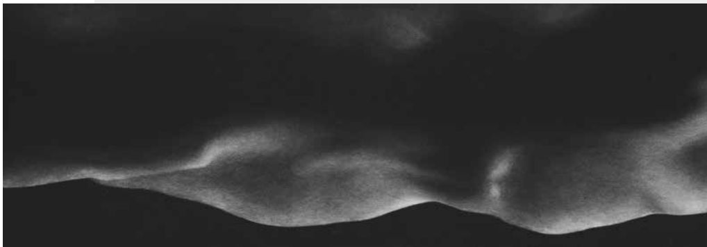
Aube 5. Mezzotinte, 40 x 80 cm (papier), 2021.

L'exposition de Guy Langevin a exploré la polymorphie du corps humain, où texture, fluidité et évanescence se mêlent à la perception et à la dualité. Le corps, support et matière de l'œuvre, dépasse sa nature pour se transformer, évoquant parfois des paysages. La lumière et l'ombre, inséparables, sculptent formes et impressions. Cette présentation invitait les visiteurs à un voyage entre clairs-obscur, paysages lunaires et corps célestes.