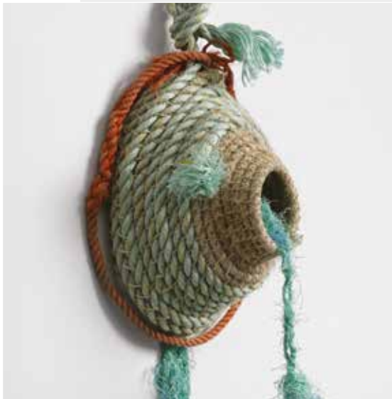
Décroché , corde marine récupérée des Îles-de-la-Madeleine, fil de sisal et tressage enroulé, 2024.